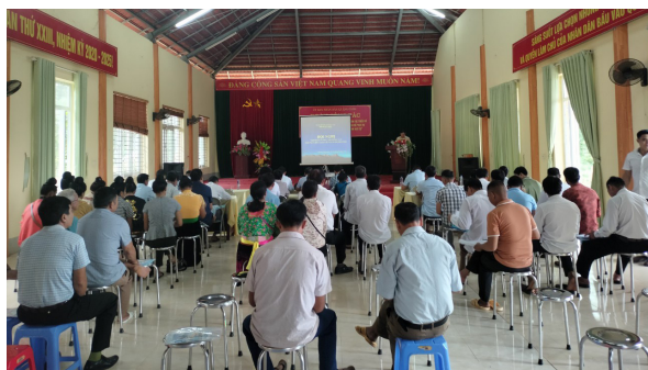
Toàn cảnh Hội nghị (xã Ằng Cang)

Tại hội nghị các đại biểu đã được nghe báo cáo viên trình bày, trao đổi các vấn đề chủ yếu về những kiến thức chung về hòa giải ở cơ sở; kỹ năng hòa giải ở cơ sở; đồng thời truyền đạt, chia sẻ kinh nghiệm, phương pháp hòa giải cùng những khó khăn, vướng mắc trong thực hiện nhiệm vụ nhằm đáp ứng yêu cầu, đòi hỏi ngày càng cao của người làm công tác hòa giải ở cơ sở trong giai đoạn hiện nay và những năm tiếp theo.