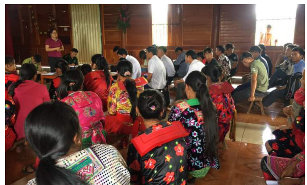
Ảnh minh họa: Công chức Phòng Tư pháp huyện Nậm Pồ tuyên truyền phổ biến giáo dục pháp luật đến người dân vùng sâu, vùng xa.