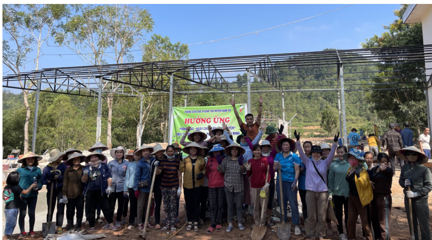
Phòng Giáo dục và Đào tạo huyện tổ chức lao động xây dựng thư viện xanh tại trường PTDTBT Tiểu học Tân Phong.

Theo đó, bằng những hành động, việc làm thiết thực, ý nghĩa gắn với từng chuyên môn, nghiệp vụ, địa bàn phụ trách, các cấp, các ngành, lực lượng vũ trang của huyện Nậm Pồ đã tích cực hưởng ứng phong trào. Các hoạt động được các cơ quan, đơn vị cân nhắc, tính toán, lên phương án để có thể tập trung giải quyết ngay được trong ngày như giúp dân, giúp các hộ neo đơn dựng nhà, cày bừa cho kịp thời vụ, chăm sóc cây xanh, sửa chữa, làm