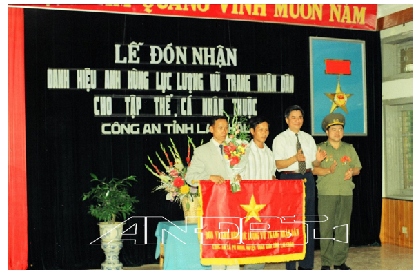
Ban Công an xã Pú Nhung, huyện Tuần Giáo đón nhận danh hiệu AHLTVTND.

là phần thưởng cao quý nhất của Đảng, Nhà nước, là niềm vinh dự, tự hào của các thế hệ Cảnh sát Việt Nam, khẳng định công lao, thành tích, sự trưởng thành lớn mạnh và là nguồn động viên khích lệ mạnh mẽ đối với CBCS toàn lực lượng), 12 Huân chương Hồ Chí Minh; 209 tập thể, cá nhân được phong tặng danh hiệu “Anh hùng LLVT nhân dân”; hàng vạn lượt tập thể, cá nhân được tặng Huân, Huy chương các loại và Bằng khen Chính