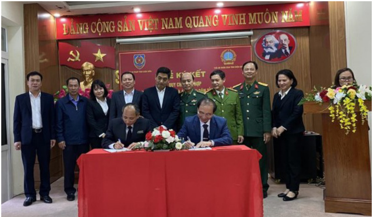
Lễ ký kết Chương trình phối hợp giữa Sở Tư pháp và Tòa án nhân dân tỉnh về TGPL trong hoạt động tố tụng.

Trong năm 2022, ngành Tư pháp các cấp trên địa bàn tỉnh Điện Biên đã triển khai đồng bộ các nhiệm vụ, giải pháp công tác Tư pháp và đạt được nhiều kết quả quan trọng trên tất cả các lĩnh vực, góp phần thúc đẩy thực hiện mục tiêu phục hồi, phát triển kinh tế - xã hội trên địa bàn tỉnh.