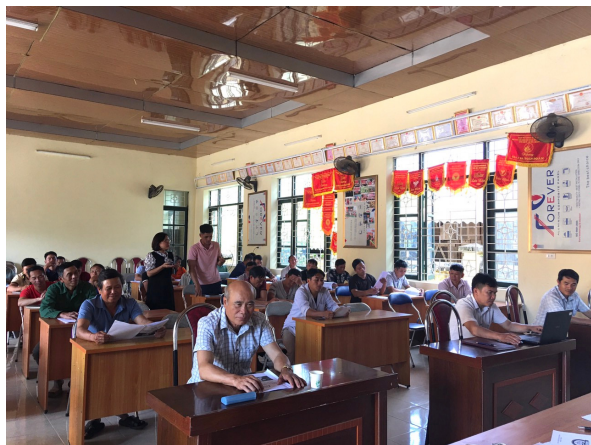
Tuyên truyền về ý nghĩa Ngày Pháp luật tại xã Chà Tở huyện Nậm Pồ

Chỉ đạo Phòng Tư pháp tuyên truyền được 21 cuộc với 2.014 lượt người tham gia; các xã tuyên truyền được 77 cuộc với 4.363 lượt người tham gia. Tổ chức cung cấp tài liệu pháp luật tới các Tuyên truyền viên để sử dụng làm tài liệu phổ biến trong tháng hành động thực hiện Ngày pháp luật.