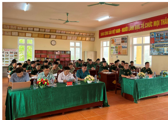
Đồn Biên phòng Si Pa Phìn tổ chức tọa đàm Ngày Pháp luật lồng ghép tại buổi giao ban quy chế phối hợp

Thông qua Ngày Pháp luật giúp cho mọi tổ chức, cá nhân công dân có ý thức tuân thủ pháp luật và cũng là dịp để đánh giá lại những kết quả đã đạt được và những hạn chế trong hoạt động xây dựng, thực thi pháp luật; đồng thời tổ chức các hoạt động phổ biến, tuyên truyền, giáo dục pháp luật cho cộng đồng được tập trung và có ý nghĩa hơn.