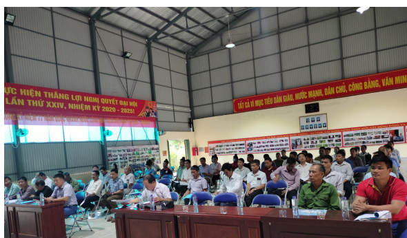
Các đại biểu tham dự hội nghị (xã Búng Lao)