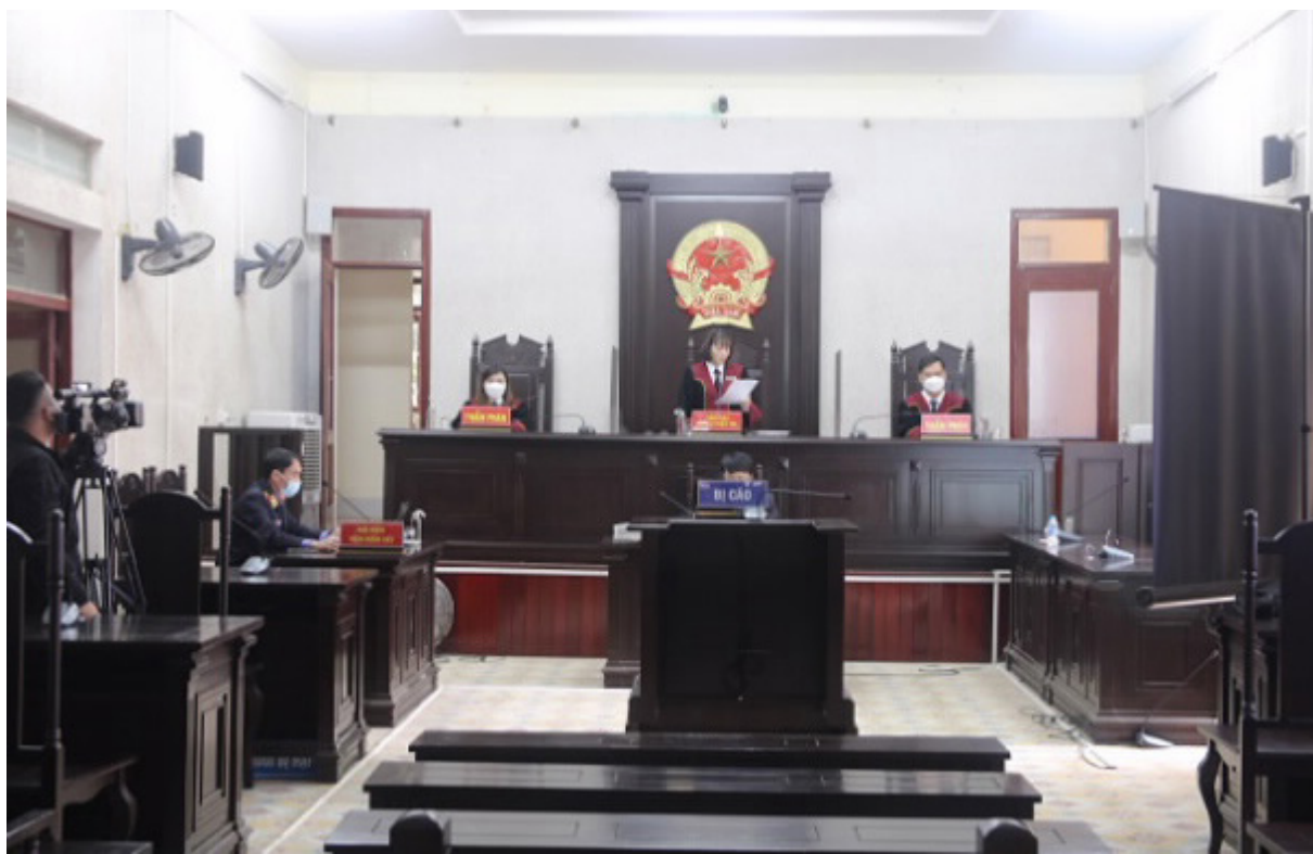
Một vụ án hình sự đang được Tòa án nhân dân tỉnh Điện Biên tiến hành xét xử trực tuyến.

TAND tỉnh quán triệt tới các Thẩm phán, Thư ký trong việc lựa chọn các