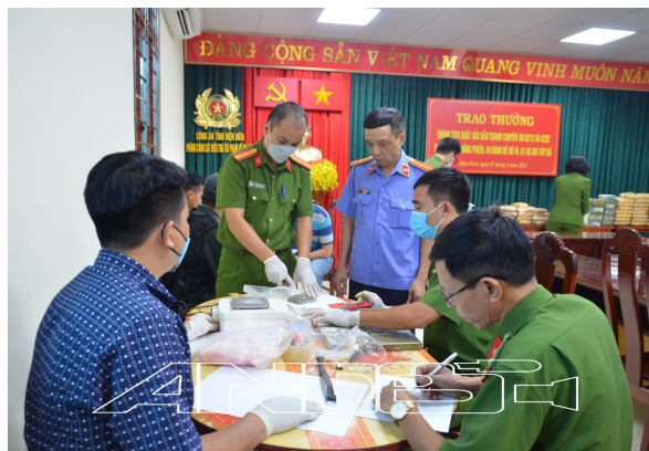
Lực lượng chức năng tiến hành mở niêm phong, cân số tang vật và lấy mẫu giám định

Trước đó, Công an tỉnh Điện Biên cũng đã triệt phá thành công chuyên án ma túy xuyên quốc gia mang bí số 422S, bắt 4 đối tượng, thu giữ 115 bánh (khối lượng 40,2kg) heroin. Theo hồ sơ vụ án, hồi 21h15' ngày 07/4/2022 Ban chuyên án do phòng Cảnh sát ĐTTP về ma túy Công an tỉnh chủ trì phối hợp với một số đơn vị nghiệp vụ thuộc Bộ công an, công an tỉnh, Công an huyện Tuần Giáo, Cục Hải quan tỉnh Điện Biên bắt quả tang 4 đối tượng mang theo 4 ba lô, bên trong chứa 115 bánh heroin cùng 5 điện thoại và 10,5 triệu đồng tiền mặt tại km 01 + 700 QL 279 thuộc địa phận thị trấn huyện Tuần Giáo, tỉnh Điện Biên khi đang trên đường vận chuyển ma túy đi tiêu thụ. 4 đối tượng bị bắt giữ cùng trú tại bản Tin Lán, xã Núa Ngam, huyện Điện Biên là Giàng A Trừ (SN 1996), Ly A Khá (SN 2000), Ly A Mạnh, Giàng A Sớ - cùng SN 2002. Tại cơ quan công an, bước đầu các đối tượng khai nhận: Số ma