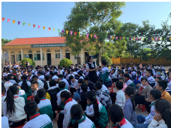
Phòng Tư pháp tổ chức buổi nói chuyện đề pháp luật tại trường THCS Si Pa Phìn

Tổ chức 02 buổi nói chuyện chuyên đề về chủ đề Ngày Pháp luật tại 02 trường Trung học cơ sở xã Si Pa Phìn, Phìn Hồ thu hút 887 học sinh và 68 cán bộ, giáo viên tham gia.