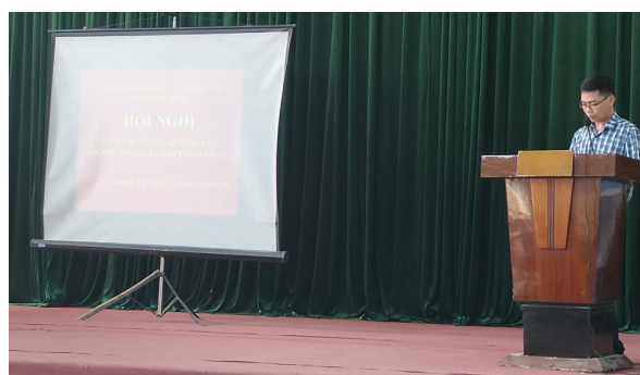
Báo cáo viên tại Hội nghị xã Ằng Nưa