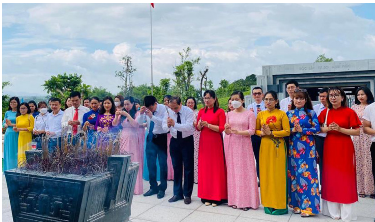
Tập thể Lãnh đạo và CCVC, NLĐ Sở Tư pháp dân hương tưởng niệm tại Đền thờ liệt sỹ Chiến trường Điện Biên Phủ

Quy định này đã cụ thể hóa chức năng, nhiệm vụ và quyền hạn của Sở Tư pháp được quy định tại Nghị định số 107/2020/NĐ-CP ngày 14 tháng 9 năm 2020 của Chính phủ sửa đổi, bổ sung một số điều của Nghị định số 24/2014/NĐ-CP ngày 04 tháng 4 năm 2014 của Chính phủ Quy định tổ chức các cơ quan chuyên môn thuộc Ủy ban nhân dân tỉnh, thành phố trực thuộc Trung ương; Thông tư số 07/2020/TT-BTP ngày 21/12/2020 của Bộ Tư pháp Hướng dẫn chức năng, nhiệm vụ và quyền hạn của Sở Tư pháp thuộc