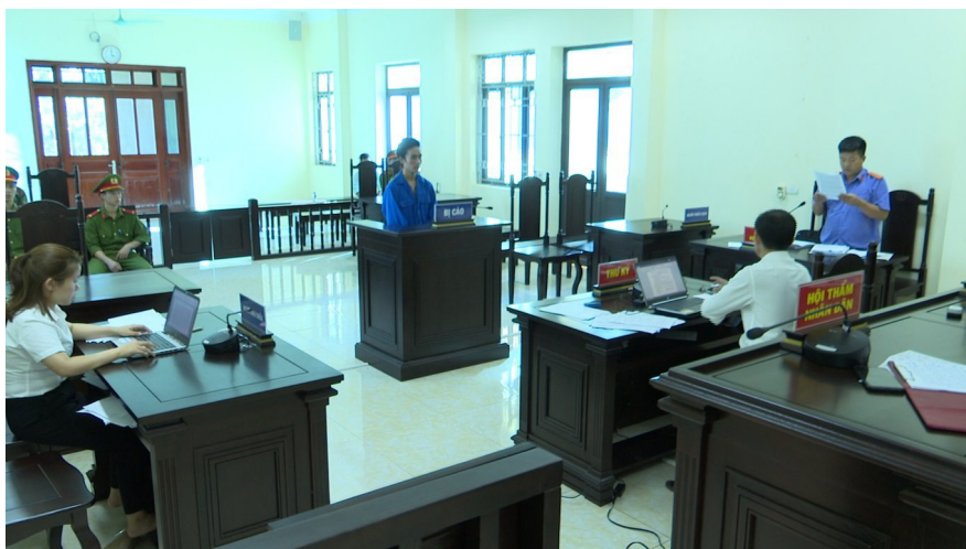
Các bị cáo nghe đại diện Viện Kiểm sát luận tội.

Vụ việc N, T, C cũng như 08 người dân bản Na Cô Sa bị truy cứu TNHS về tội hủy hoại rừng cũng như nhiều vụ việc vi phạm pháp luật khác liên quan đến vi phạm quy định về khai thác, quản lý, bảo vệ rừng, lâm sản; quản lý, sử dụng vũ khí vật liệu nổ trong thời gian qua đặt ra nhiệm vụ đối với chính quyền địa phương và các cơ quan chức năng trên địa bàn tăng cường hơn nữa công tác quản lý; có biện pháp phù hợp để tuyên truyền pháp luật, nâng cao nhận thức pháp luật cho người dân, vận động người dân nâng cao ý thức chấp hành pháp luật. Qua đó cũng là bài học cho người dân về ý thức chấp hành pháp luật, nâng cao kỹ năng sống, kiến thức pháp luật để phòng tránh vi phạm pháp luật đáng tiếc xảy ra./.