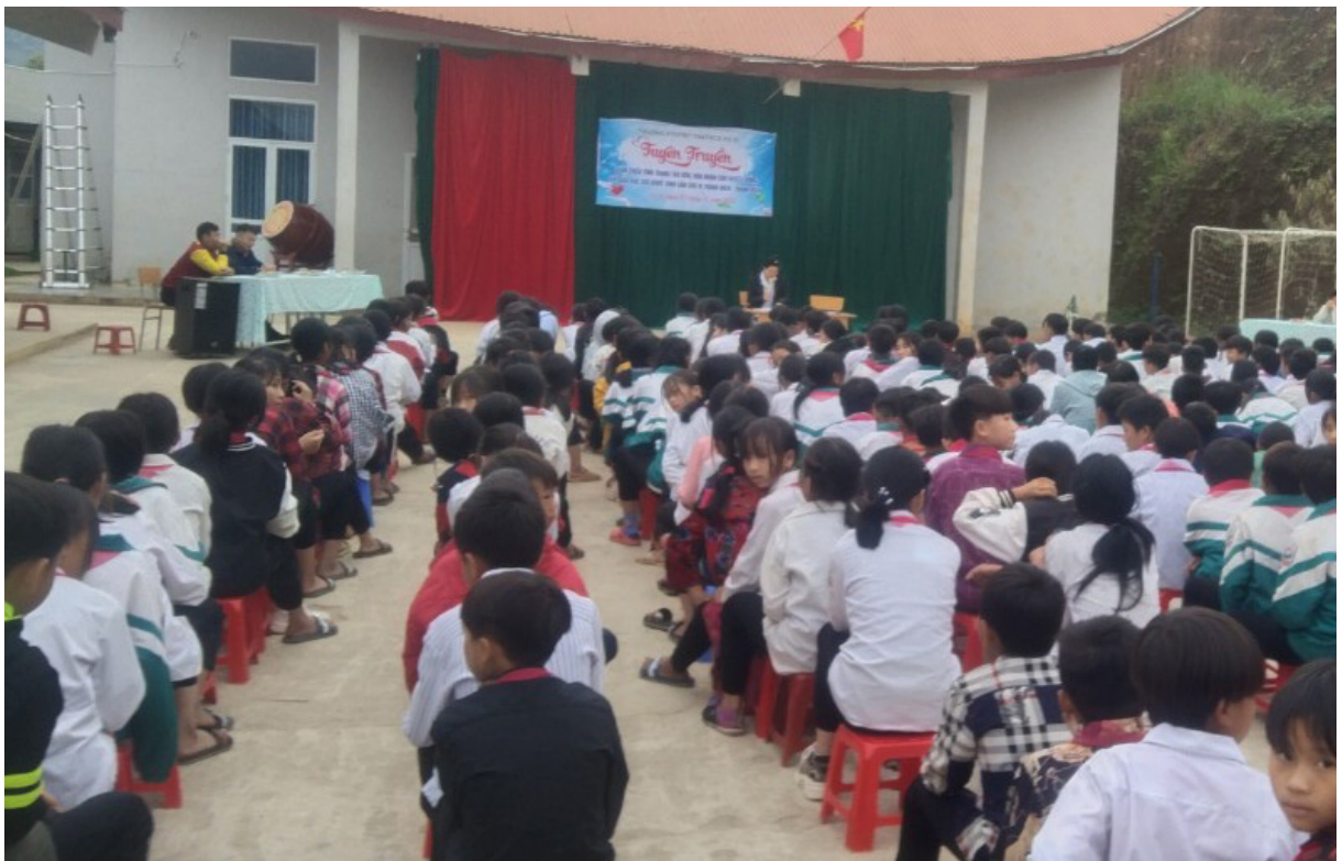
Tại buổi tuyên truyền.

Bên cạnh việc triển khai các nội dung, Buổi tuyên truyền cũng đã dành thời gian để các cháu học sinh thảo luận về các quy định của pháp luật và trả lời một số câu hỏi tình huống, đồng thời nêu lên những nguyên nhân, khắc phục các nguyên nhân chủ yếu dẫn đến tảo hôn, hôn nhân cận huyết thống cho các cháu học sinh./.