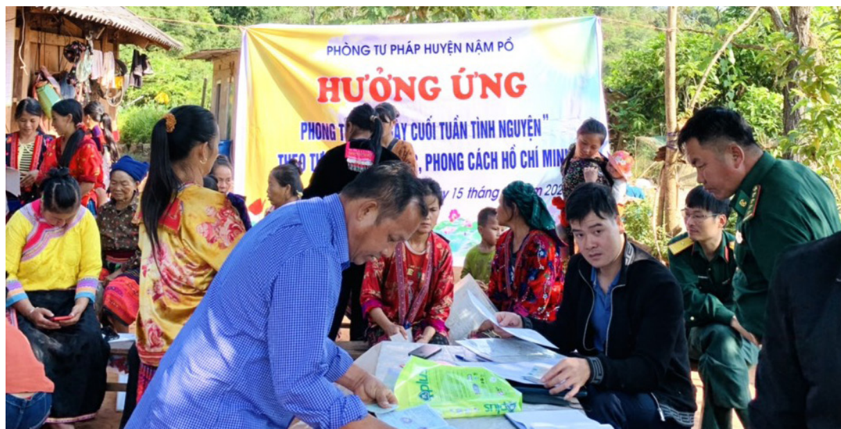
Phòng Tư pháp huyện Nậm Pồ tổ chức thực hiện “Ngày cuối tuần tình nguyện” tại bản Mạ Hốc xã Phìn Hồ.

Đây là một Phong trào hết sức nhân văn và ý nghĩa cần được lan tỏa rộng rãi, phong trào vừa mang lại lợi ích thiết thực cho người dân đồng thời tạo cho cán bộ, chiến sĩ, công chức, viên chức, người lao động trên địa bàn thấm nhuần tư tưởng đạo đức, phong cách Hồ Chí Minh trong thực hiện nhiệm vụ, công vụ./.